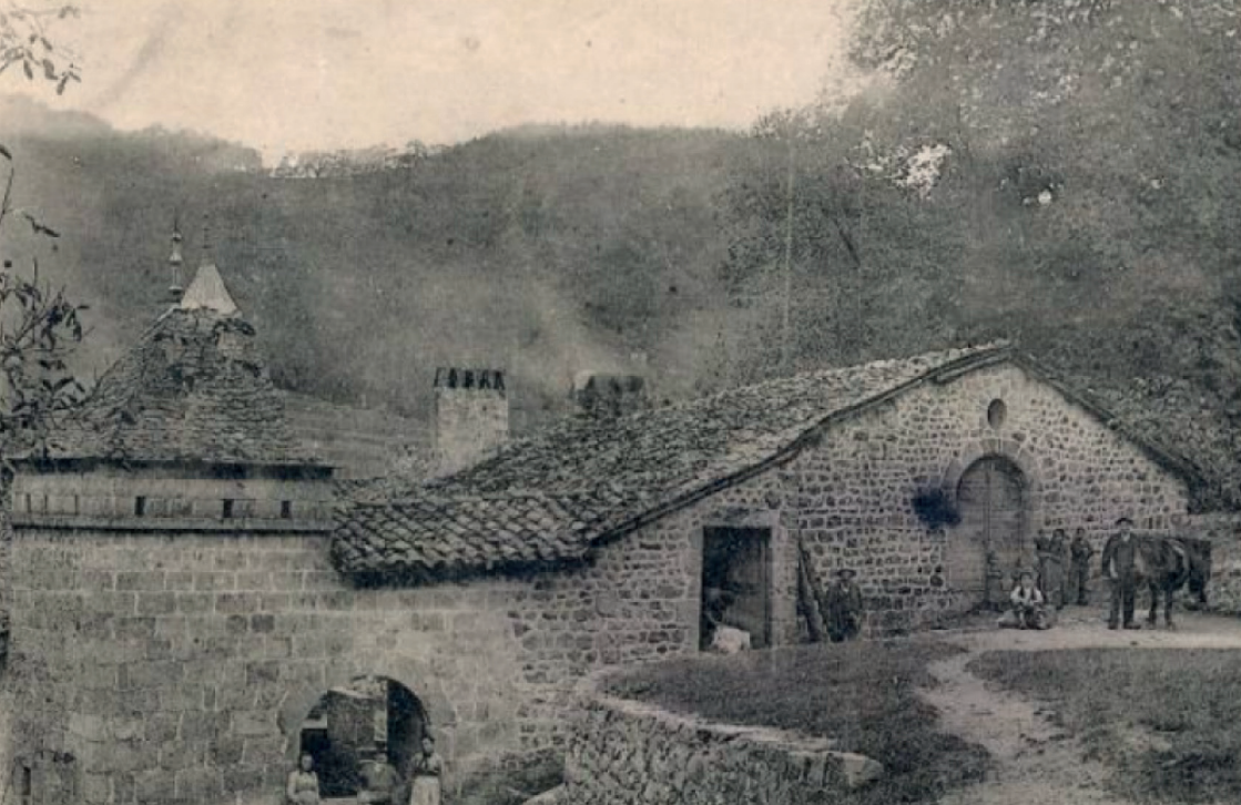
Manoir de Mirabel, Saint Christol (photo du haut réalisée en 1904 et photo du bas en 2023)