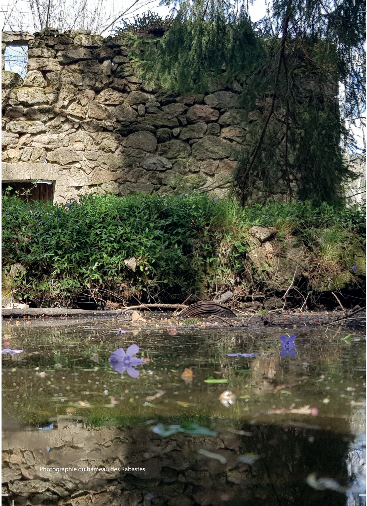
Photographie du hameau des Rabastes